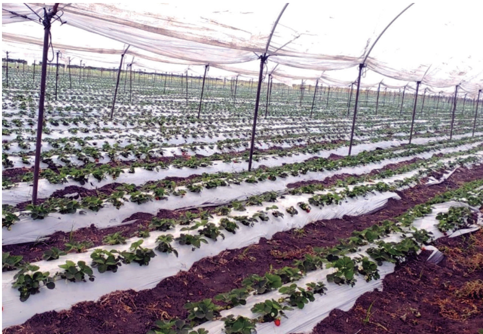
Figura 1. Acolchado y macro túnel para fresa.

estos plásticos ocurre a través de mecanismos naturales como la fotodegradación, la biodegradación y la oxidación, procesos que están modulados por variables ambientales tales como la radiación ultravioleta, la temperatura, la humedad y la actividad microbiana. Adicionalmente, intervenciones agronómicas como el uso de maquinaria pesada, la incorporación de agroquímicos (fertilizantes y pesticidas que pueden alterar la estructura química de los polímeros) y el laboreo intensivo del suelo, aceleran la fragmentación física de los plásticos en partículas de tamaño micro y nanométrico (Almeida-Sanisaca, 2025; Tian et al., 2022). La mayoría de estos materiales plásticos están compuestos de PE, un polímero termoplástico de alta estabilidad química y baja biodegradabilidad, ampliamente utilizado en aplicaciones agrícolas debido a su bajo costo, flexibilidad, y resistencia mecánica. Sin embargo, estas mismas propiedades son las que dificultan su descomposición completa en el ambiente, promoviendo su persistencia en el suelo en forma de MPs, lo que representa un riesgo potencial para la salud del ecosistema y la productividad agrícola a largo plazo (Naciones Unidas, 2022).