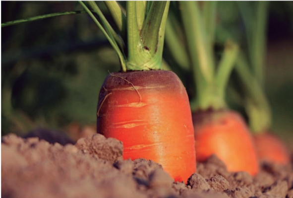
Figura 3. Cultivo de zanahoria.

genera preocupación sobre su impacto en la seguridad alimentaria y la salud de los consumidores, ya que se relaciona con posibles alteraciones hormonales, inflamación intestinal y bioacumulación de sustancias tóxicas (Almeida-Sanisaca, 2025). Un estudio reportó la presencia de entre 52,050 y 233,000 partículas plásticas inferiores a 10 micrómetros en una variedad de frutas y hortalizas. Las manzanas y las zanahorias (figura 3) fueron identificadas como los productos con mayores niveles de contaminación, alcanzando concentraciones superiores a 100,000 MPs por gramo. Las partículas de menor tamaño se detectaron en las zanahorias, mientras que los fragmentos plásticos de mayor dimensión se hallaron en la lechuga, que, a su vez, presentó los niveles más bajos de contaminación entre las verduras analizadas (LaMotte, 2024).