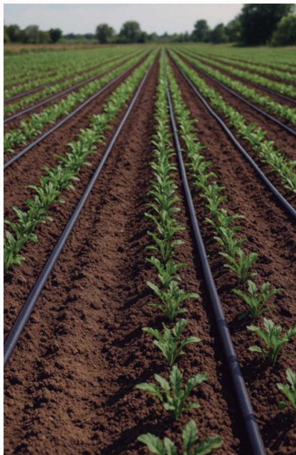
Figura 2. Mangueras de riego agrícola dispuestas entre hileras de cultivos. (OpenAI, 2025)

La incorporación de lodos provenientes del tratamiento de aguas residuales en suelos agrícolas constituye una práctica ampliamente utilizada, debido a su capacidad para mejorar la fertilidad edáfica. Estos materiales, ricos en materia orgánica y elementos nutritivos, contribuyen positivamente a la estructura del suelo, incrementan su capacidad de retención hídrica y optimizan la disponibilidad de nutrientes para el desarrollo vegetal (Potisek-Talavera et al., 2010). No obstante, su aplicación no está exenta de riesgos, ya que pueden contener patógenos, metales pesados y diversos contaminantes emergentes que requieren una gestión rigurosa. De manera particularmente relevante, se ha señalado que esta estrategia de enmienda agrícola puede introducir volúmenes significativos de MPs en los suelos, superando incluso las concentraciones detectadas en medios marinos (Wu et al., 2024).