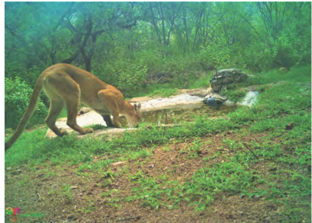
Figura 3. Puma haciendo uso de un bebedero artificial

Como se mencionó previamente, es una ANP de tipo federal (más en concreto una Reserva de la Biosfera), la cual atraviesa los estados de Querétaro, San Luis Potosí, Hidalgo y Guanajuato, la sección perteneciente a nuestro estado es a la que nos referimos como SGG. Dentro de las ANP es considerada como una de las menos modificadas y la que cuenta con mayor diversidad, territorialmente abarca los municipios de Xichú, Atarjea, Santa Catarina y el norte de los municipios de San Luis de la Paz y Victoria ocupando un total del 8.92 % del territorio estatal. Dentro de esta reserva se encuentra el Rancho la Onza (Fig. 2).