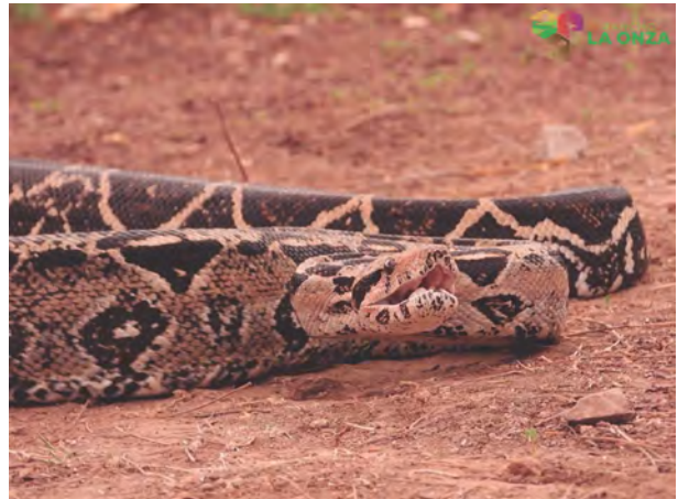
Figura 4. Boa ( Boa imperator )

El estado de Guanajuato posee un gran patrimonio natural que gracias a proyectos como el Rancho la Onza nos es posible apreciar como es debido, es por lo que se invita a los lectores a darse la oportunidad de conocer los diversos tesoros naturales que nuestro estado tiene para ofrecernos.