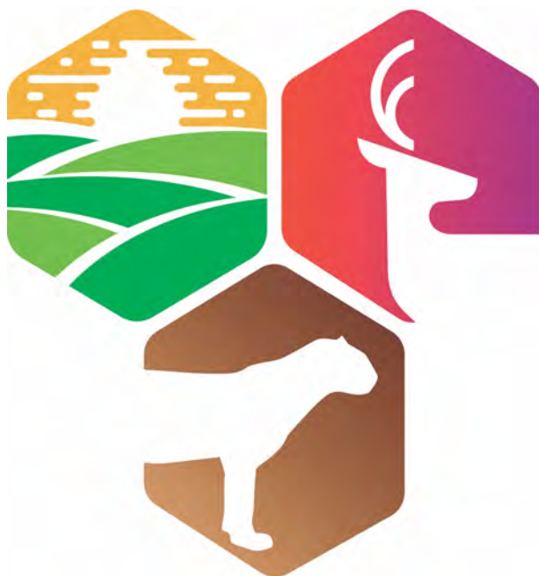
Figura 2. Logotipo del rancho la Onza